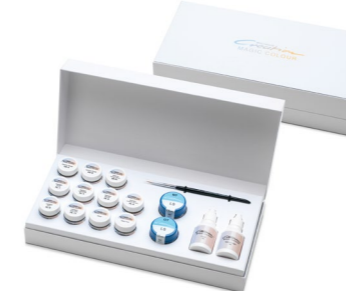
Magic Colour Starter Kit LS