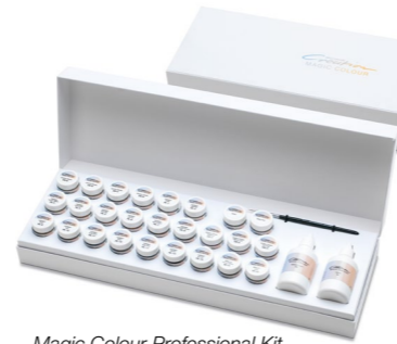
Magic Colour Professional Kit