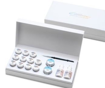
Magic Colour Starter Kit ZI-F